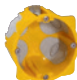
0 800 21