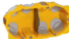
0 800 22