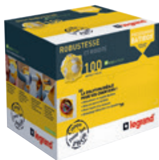
0 800 12

boîtes d'encastrement pour cloisons sèches