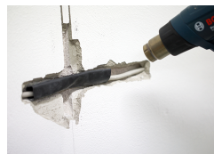
Heat the shrink tube and properly reclose the damaged area.