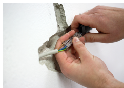
Connect the cable using the cable repair kit.