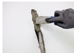
Close the damaged area discreetly.