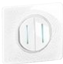
2 x CM0221 + enjoliveur + plaque Blanc Relief