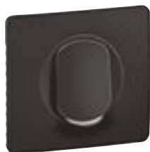
CM0223 + enjoliveur + plaque Noir Mat